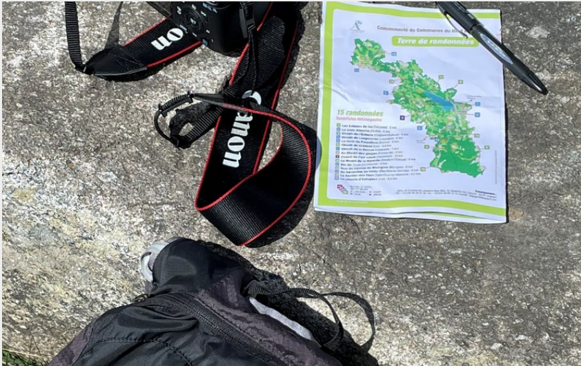
L'équipement du randonneur contemplatif