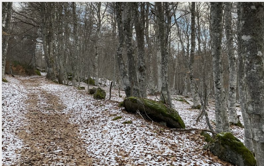
Entre forêt de hêtres et blocs de granit