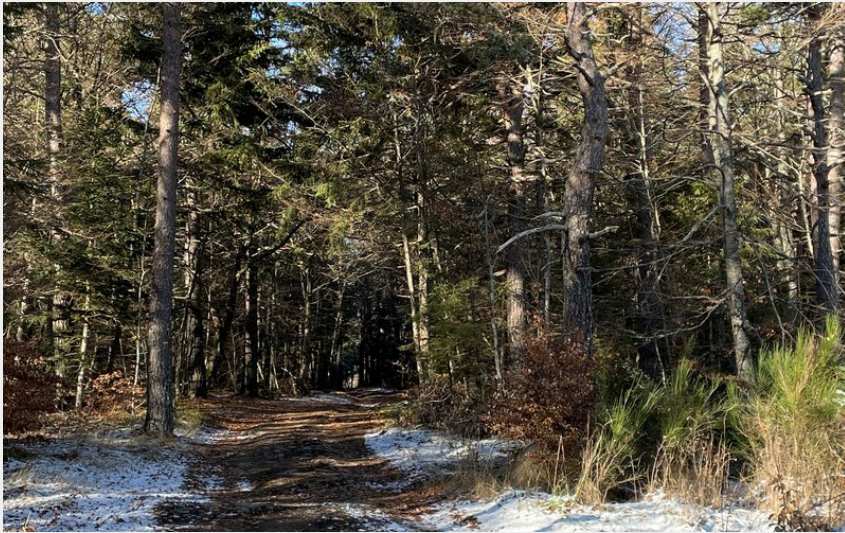
Traversée en forêt