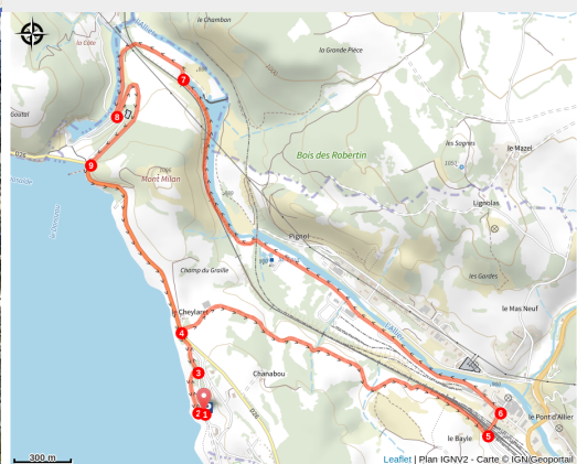
Panoramique des circuits VTT au départ de l'itinéraire