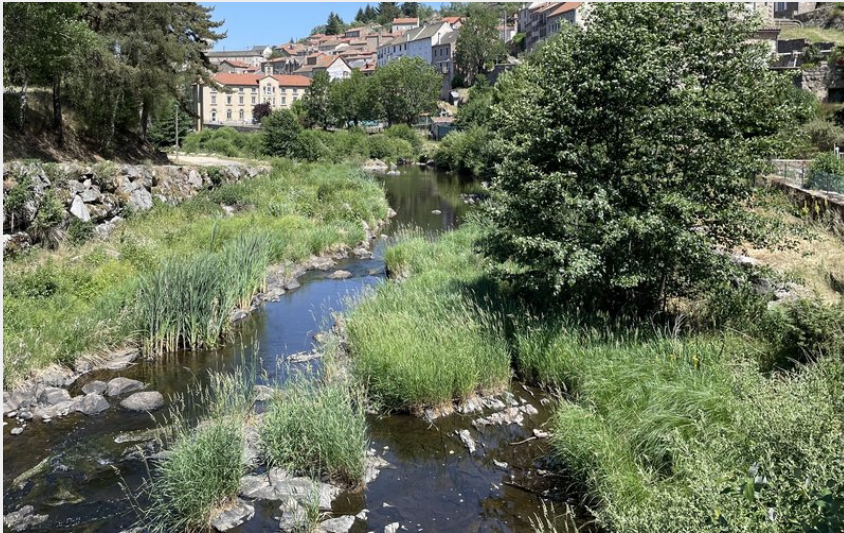
Le Chapeauroux dans la traversée d'Auroux