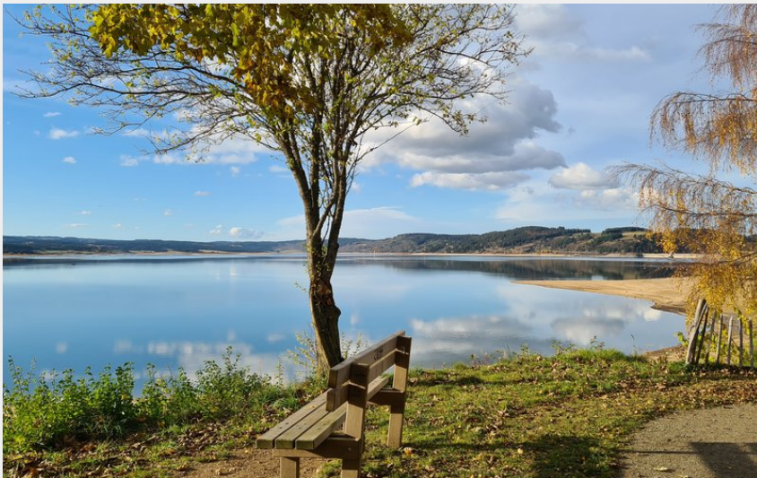
Prendre le temps sur le chemin