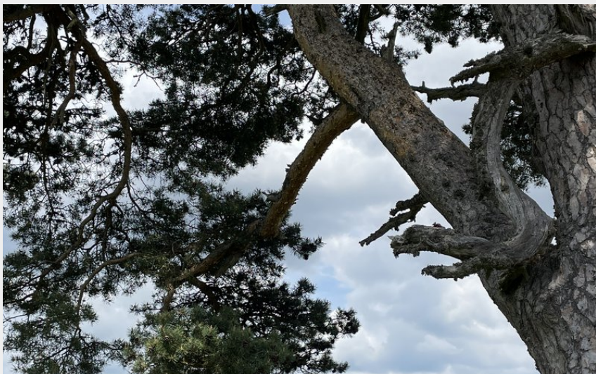
Point de vue sur la vallée de l'Allier et le Velay