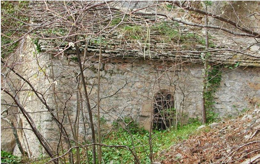
Chapelle de San Chaousou sur le Causse de Changefège