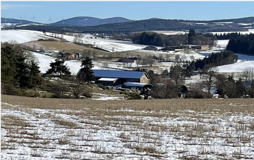
Vue sur les monts ardéchois (CCHA)