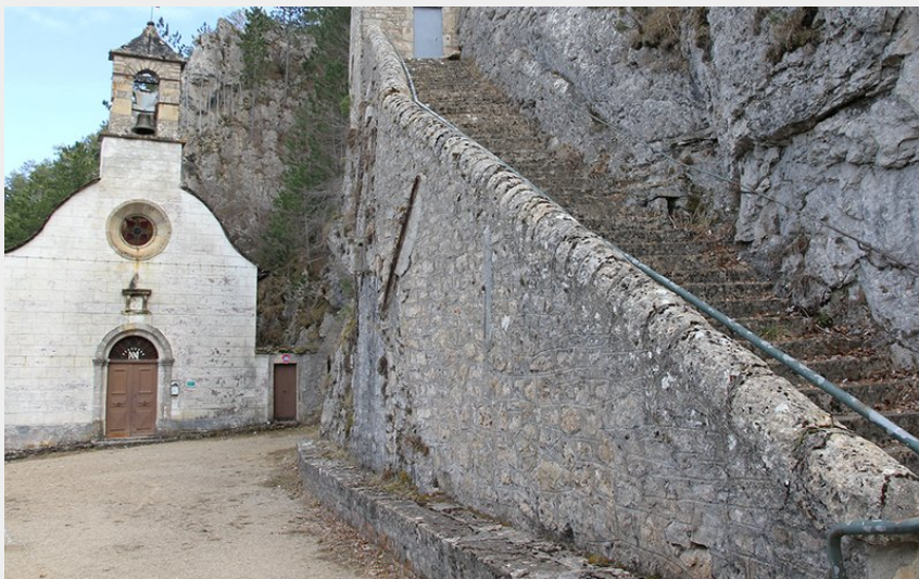
Ermitage de Saint-Privat