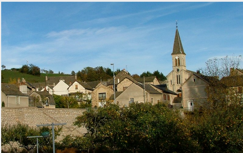
Badaroux village