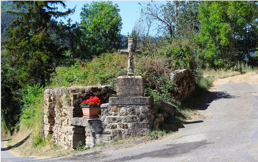
Croisement de chemins à Pelgeires