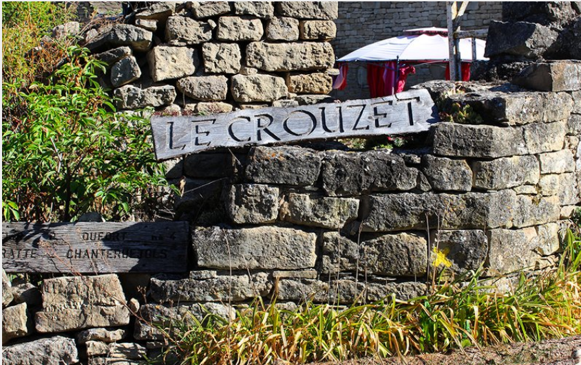
Hameau du Crouzet (Chastel-Nouvel - 48)