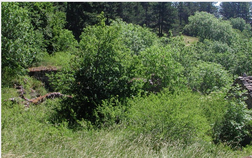
Hameau abandonné du Gerbal