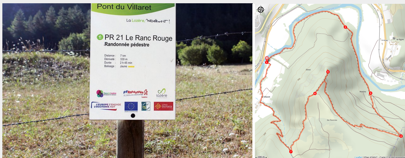
Panneau départ du sentier Ranc Rouge

Ce circuit, au départ du pont du Villaret, vous fera remonter le long du Lot sur sa rive gauche avant de grimper sur un éperon du Causse de Sauveterre dominé par le "Ranc rouge". Cette déformation du mot occitan "ronc" signifie "rocher" : ici, le calcaire est teinté de rougeâtre par des oxydes de fer.