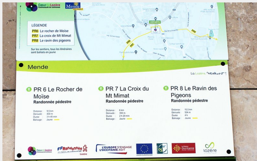
Panneau de départ du sentier sur la place du Foirail