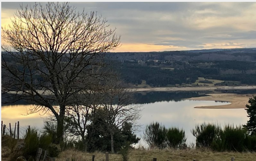
Vue sur le lac depuis l'itinéraire de randonnée