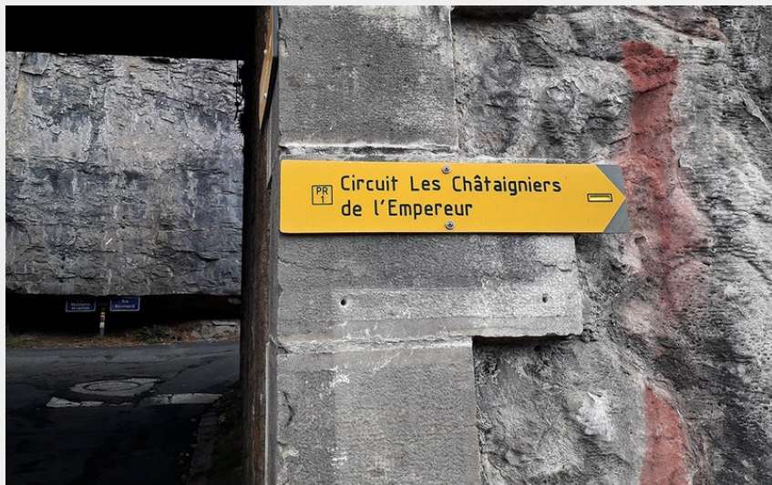
Panneau indicatif du circuit Les châtaigniers de l'empereur