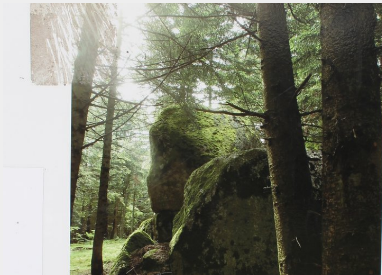
Un des panneaux à rencontrer en chemin