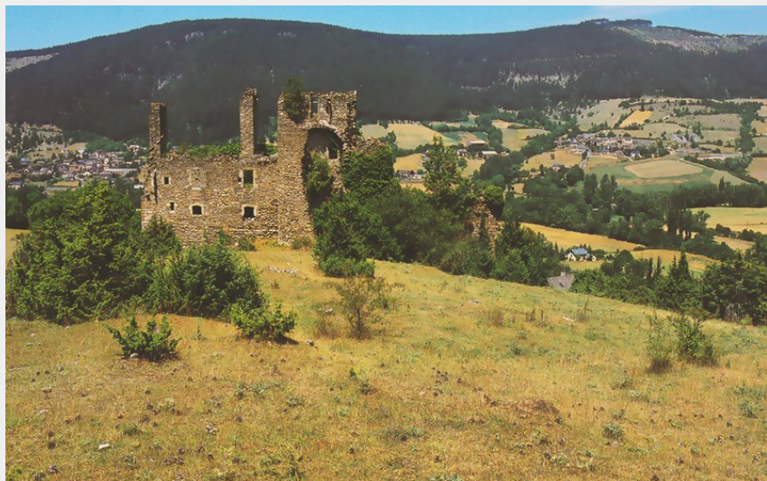
Ruines du château de Montialoux