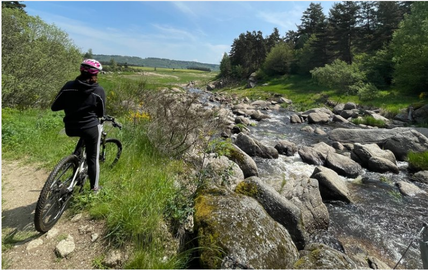
Sur la passerelle du Chapeauroux (CCHA)