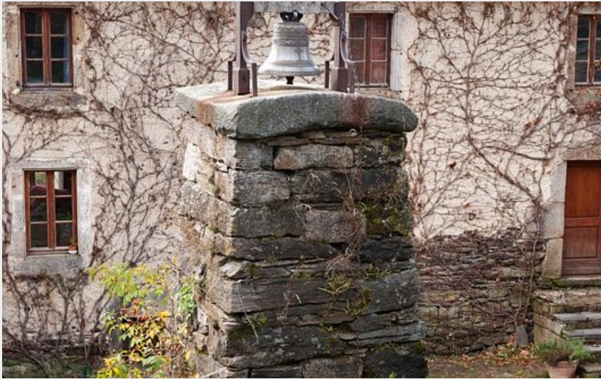
Clocher de tourmente d'Auriac