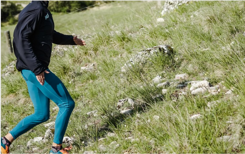
Traileur en montée