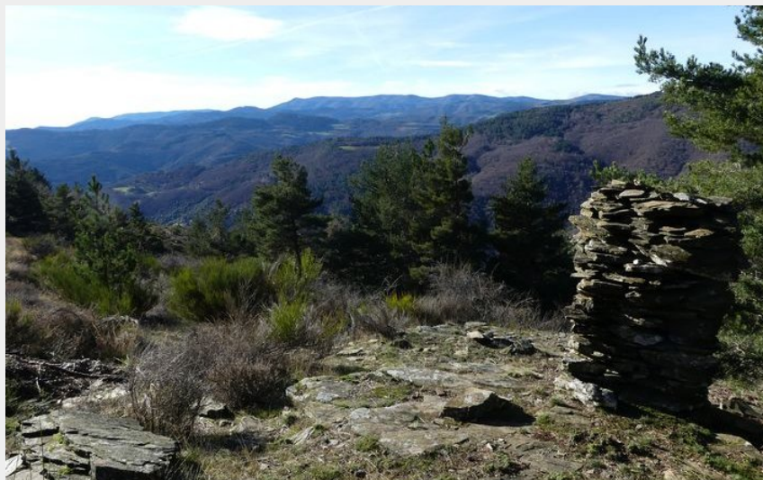
Vue sur l'Aigoual (nathalie.thomas)