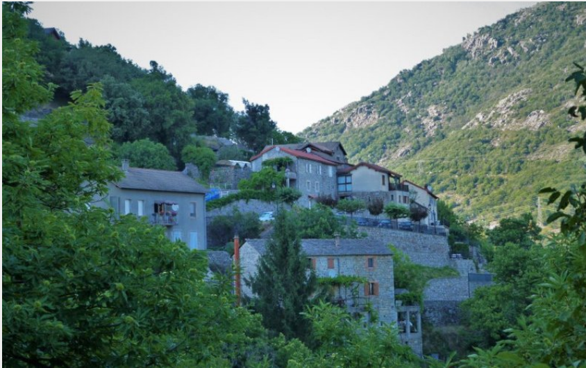
(OT Mont Lozère)