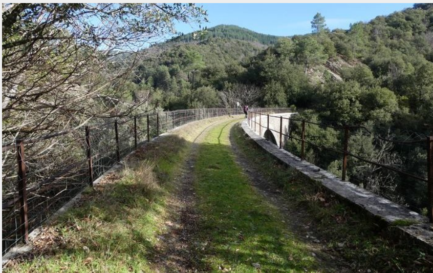
La voie ferrée (nathalie.thomas)