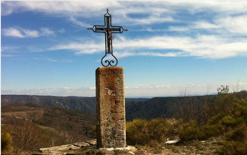
(OT Mont Lozère)