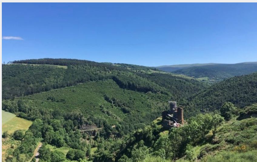
Château du Tournel