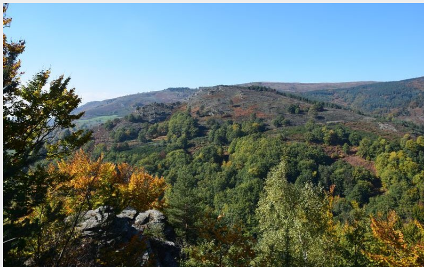
Vue sur Bougeset