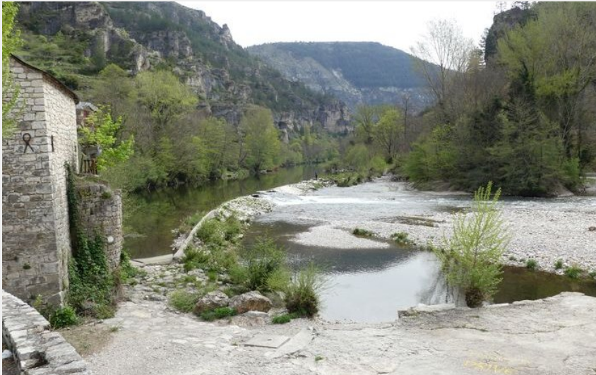
Le Tarn à Sainte-Enimie (nathalie.thomas)