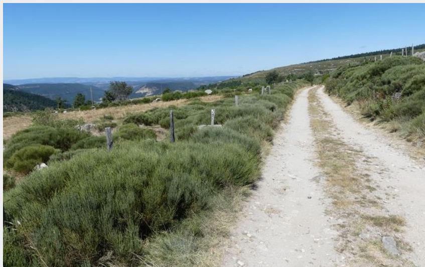
Paysage du mont Lozère (Nathalie Thomas)