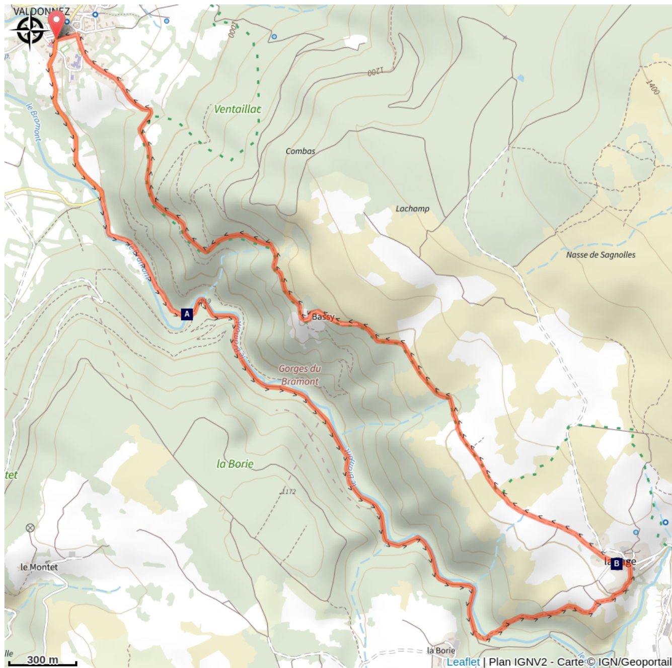
Le Bramont (A)