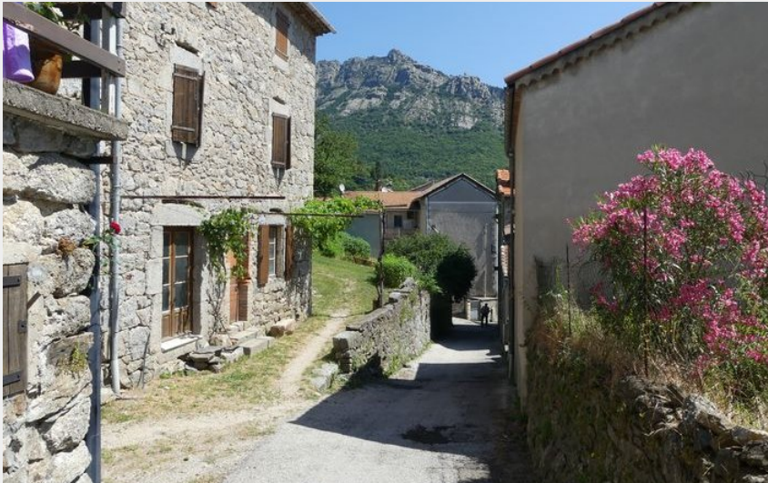
Vialas et les rochers de Trenzé (nathalie.thomas)