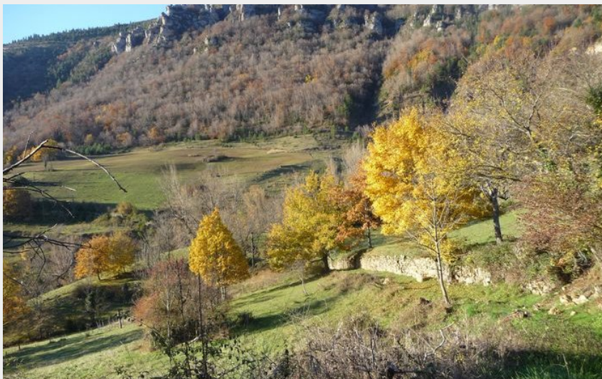
Vue sur les corniches