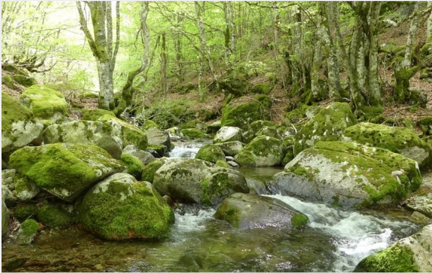
La Jonte (nathalie.thomas)