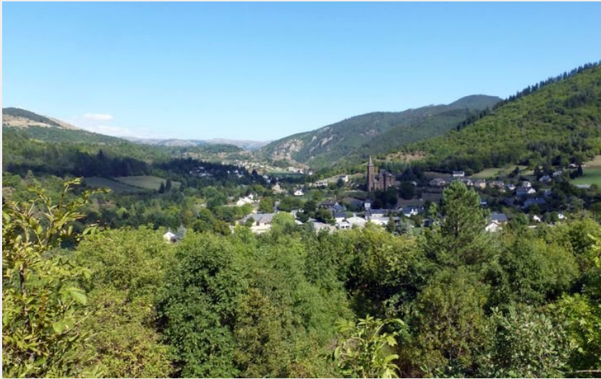
Vue sur Bédouès