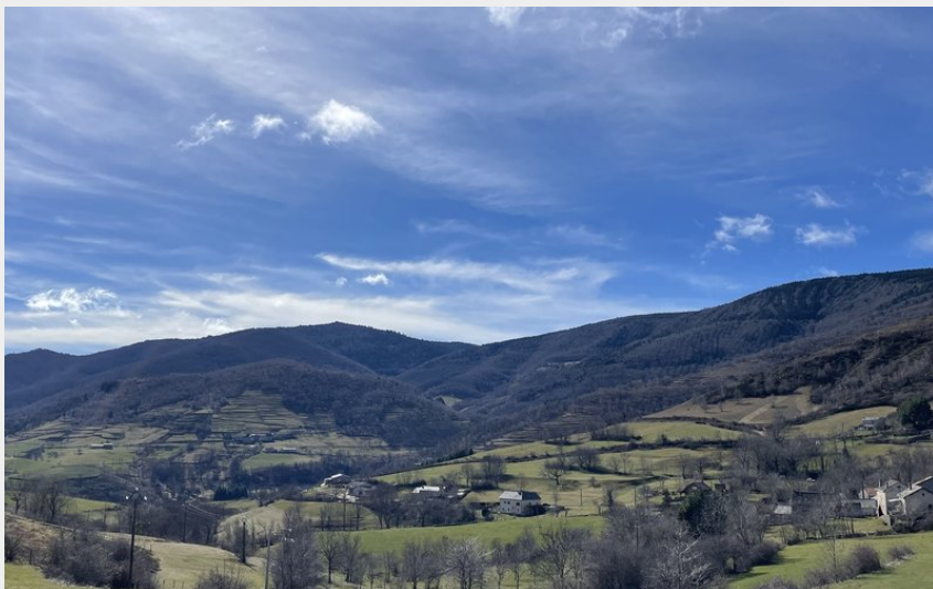
Le Bergognon (OT Mont Lozère)