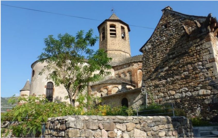
L'Eglise d'Ispagnac