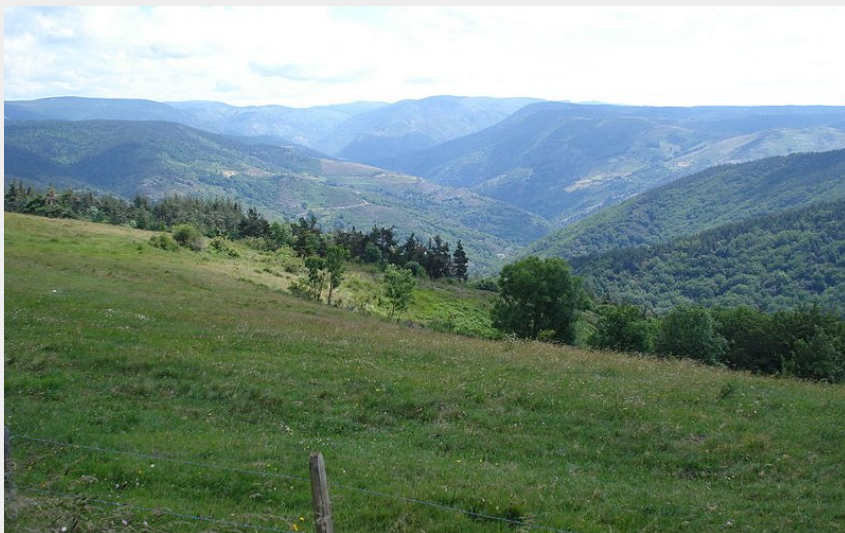
Col du Thort (Havang(nl))