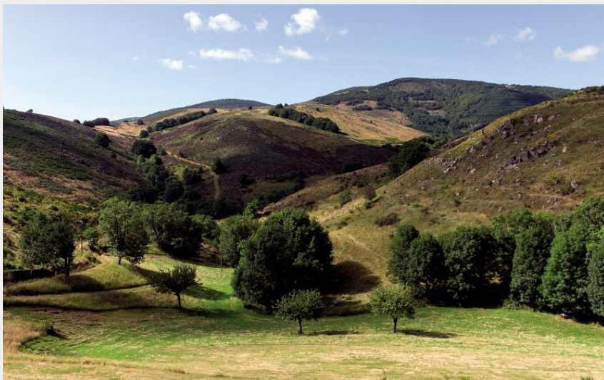
Les paysages de l'Aigoual (Olivier Prohin)