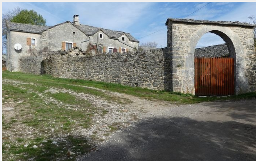
Le village de Drigas (nathalie.thomas)