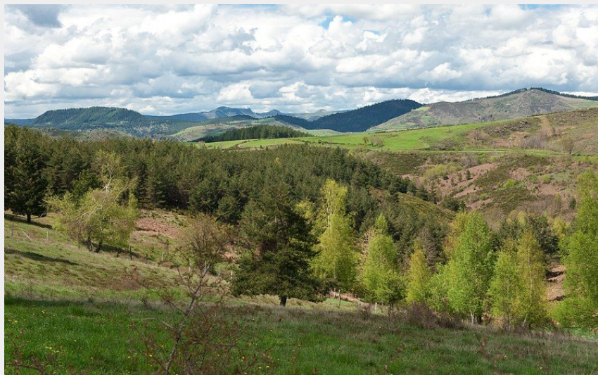
Col de l'Oumenet