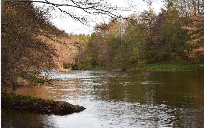
Le Tarn à Bédouès