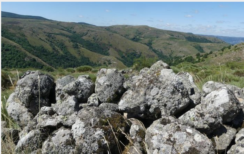
Vue sur la Cham de l'Hermet