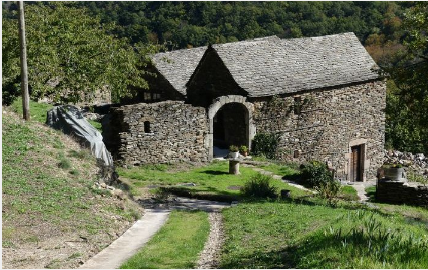
Le Villaret