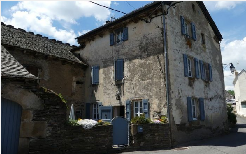
Bagnols les Bains (N Thomas)