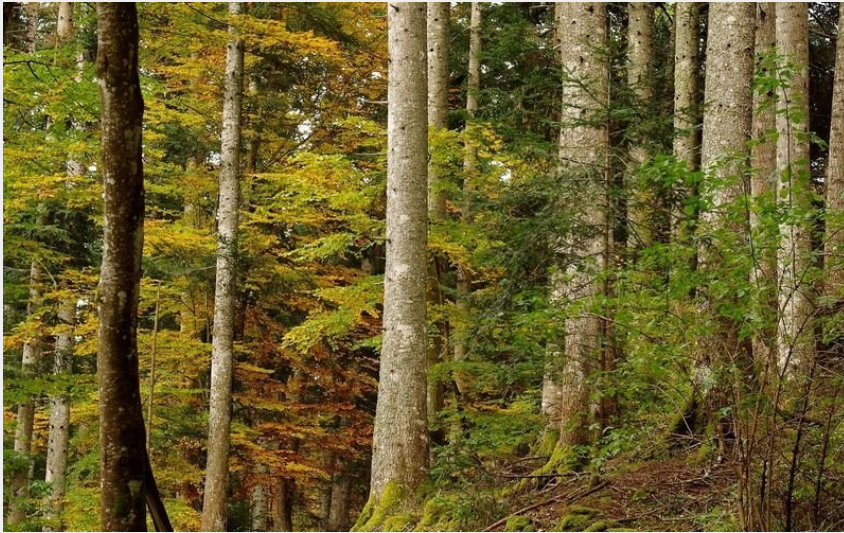
Forêt du Mont Lozère