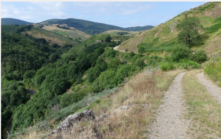
La vallée du Tapoul (PnC-N Thomas)