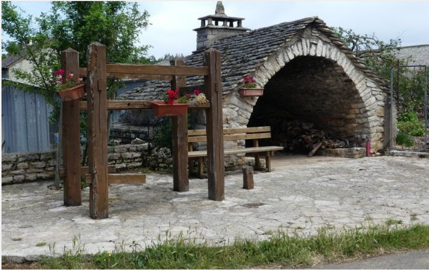
Four à pain (nathalie.thomas)