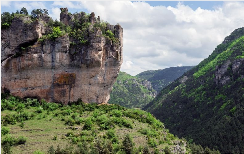
Roc de Saint-Gervais (Bruno Daversin)