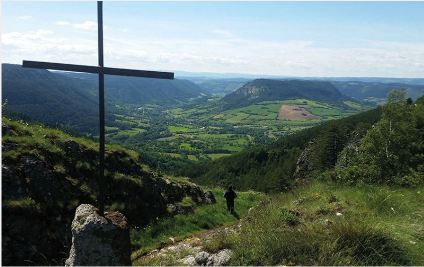
Truc de Balduc